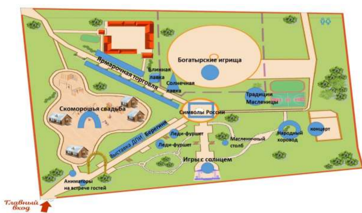
Схема проведения народного гуляния «Широкая Масленица» 26.02.2023 г. в 12:00 часов в центральном парке культуры и отдыха

Заместитель главы города по социальной политике