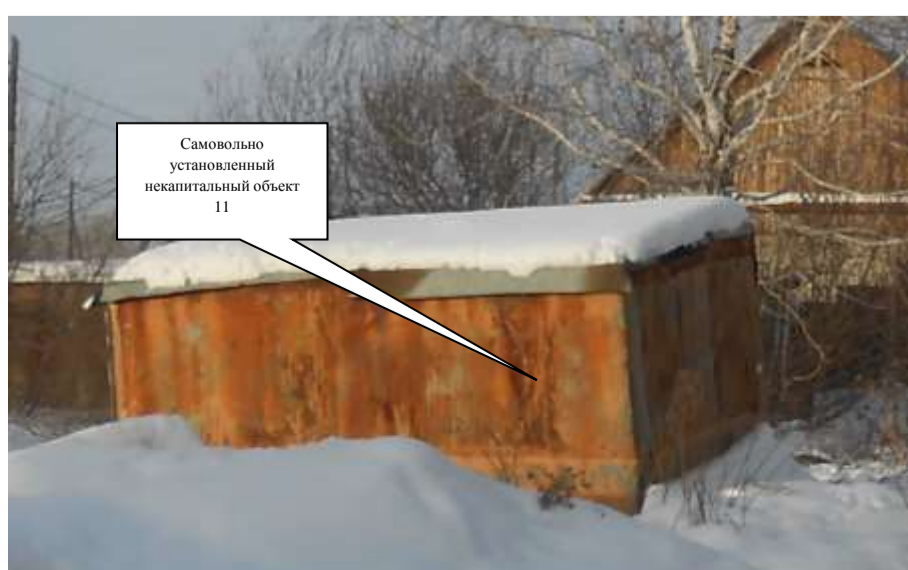
Самовольно установленный некапитальный объект 11

Комиссия приняла решение о необходимости демонтажа некапитального объекта и освобождении земельного участка в течение 7 дней со дня опубликования