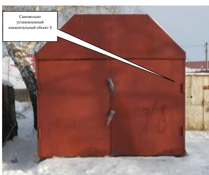
Самовольно установленный некапитальный объект 8

Комиссия приняла решение о необходимости демонтажа некапитального объекта и освобождении земельного участка в течение 7 дней со дня опубликования