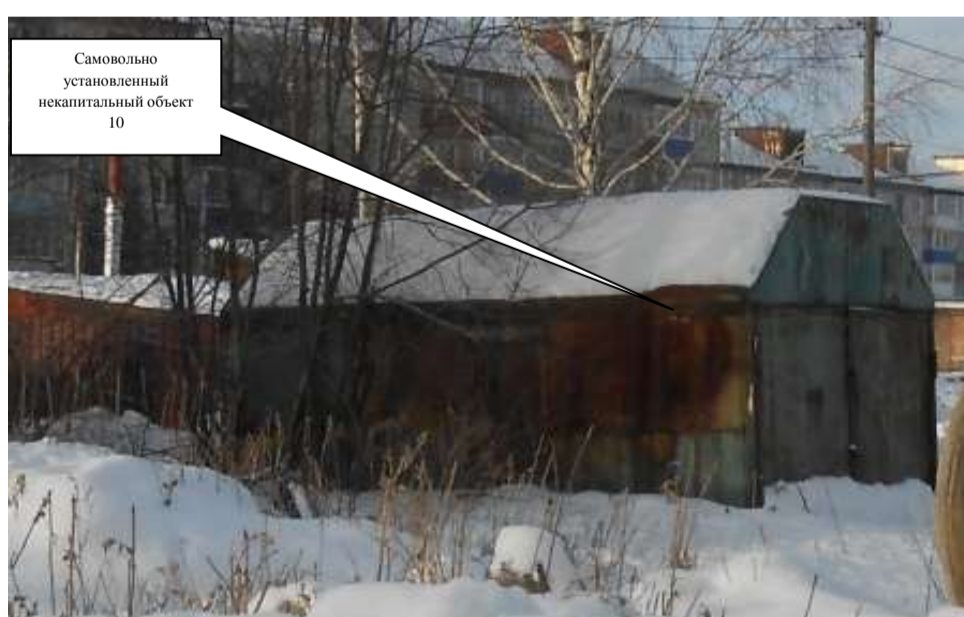
Самовольно установленный некапитальный объект 10

Комиссия приняла решение о необходимости демонтажа некапитального объекта и освобождении земельного участка в течение 7 дней со дня опубликования