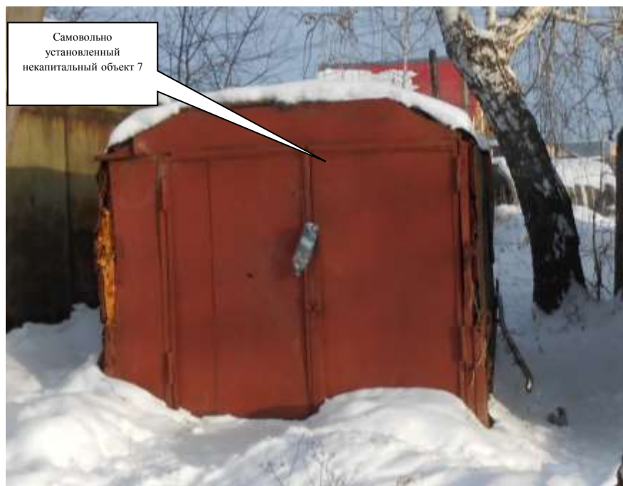
Самовольно установленный некапитальный объект 7

Информация о факте выявления самовольно установленного некапитального временного объекта по адресу ориентир: г. Канск, мкр. 6-й Северо-западный, с северной стороны гск Чермуха-1 (объект 8)