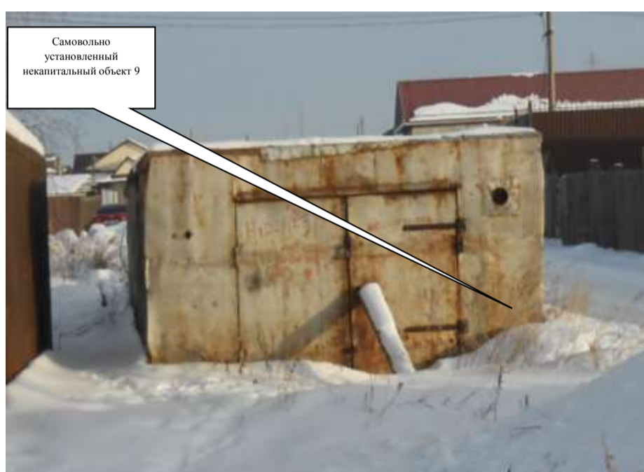
Самовольно установленный некапитальный объект 9

Комиссия приняла решение о необходимости демонтажа некапитального объекта и освобождении земельного участка в течение 7 дней со дня опубликования