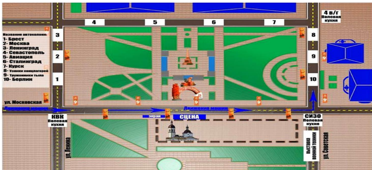
Схема расположения театрализованных площадок на площади им. Н.И. Коростелева

Заместитель главы города по социальной политике