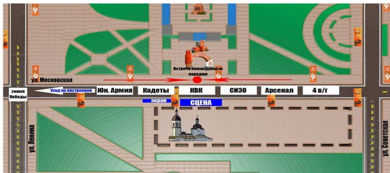
Схема построения колонн военнослужащих, силовых структур, кадетов

Заместитель главы города по социальной политике