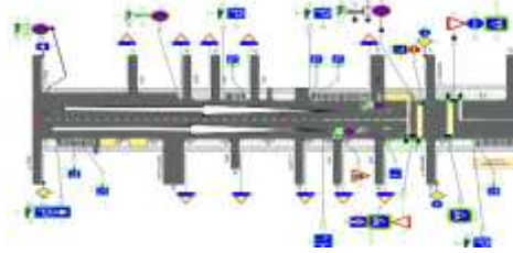
Схема одностороннего движения на улице Урицкого на участке от ул. Ленина до ул. Коростелева города Канска