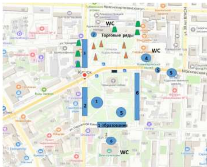
Схема размещения интерактивных и творческих площадок

Приложение № 3 к Постановлению администрации г. Канска от 22.08.2023 г. № 970