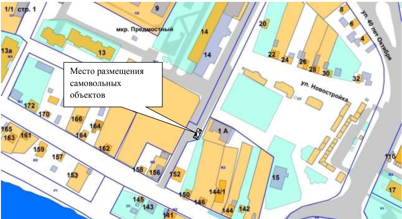
Фрагмент дежурной карты М 1:1000