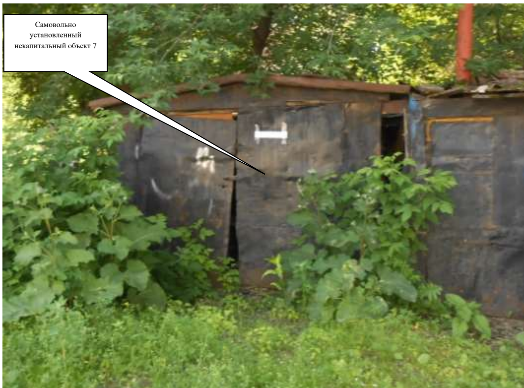
Самовольно установленный некапитальный объект 7

Комиссия приняла решение о необходимости демонтажа некапитального объекта и освобождении земельного участка в течение 7 дней со дня опубликования