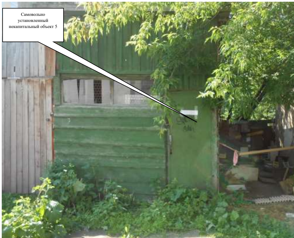
Информация о факте выявления самовольно установленного некапитального временного объекта по адресному ориентиру: г. Канск, ул. Сибирская, дворовая территории многоквартирного жилого дома № 12 (объект 6)

Комиссия приняла решение о необходимости демонтажа некапитального объекта и освобождении земельного участка в течение 7 дней со дня опубликования