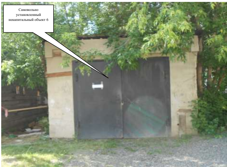
Самовольно установленный некапитальный объект 6

Информация о факте выявления самовольно установленного некапитального временного объекта по адресному ориентиру: г. Канск, ул. Сибирская, дворовая территория многоквартирного жилого дома № 12 (объект 7)