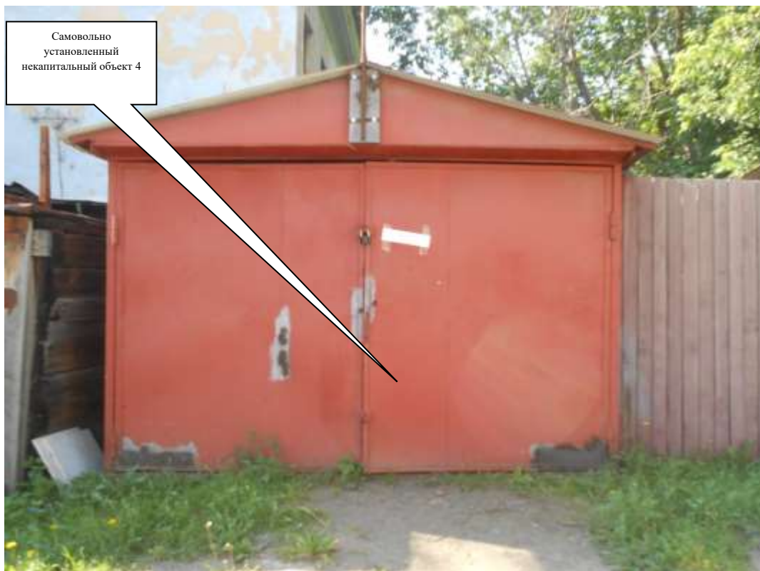
Информация о факте выявления самовольно установленного некапитального временного объекта по адресному ориентиру: г. Канск, ул. Сибирская, дворовая территории многоквартирного жилого дома № 12 (объект 5)