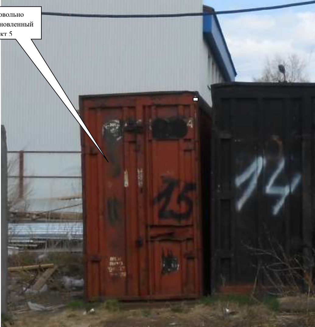
Информация о факте выявления самовольно установленного некапитального временного объекта по адресу: ориентир: г. Канск, ул. Московская, 84 (объект 6)