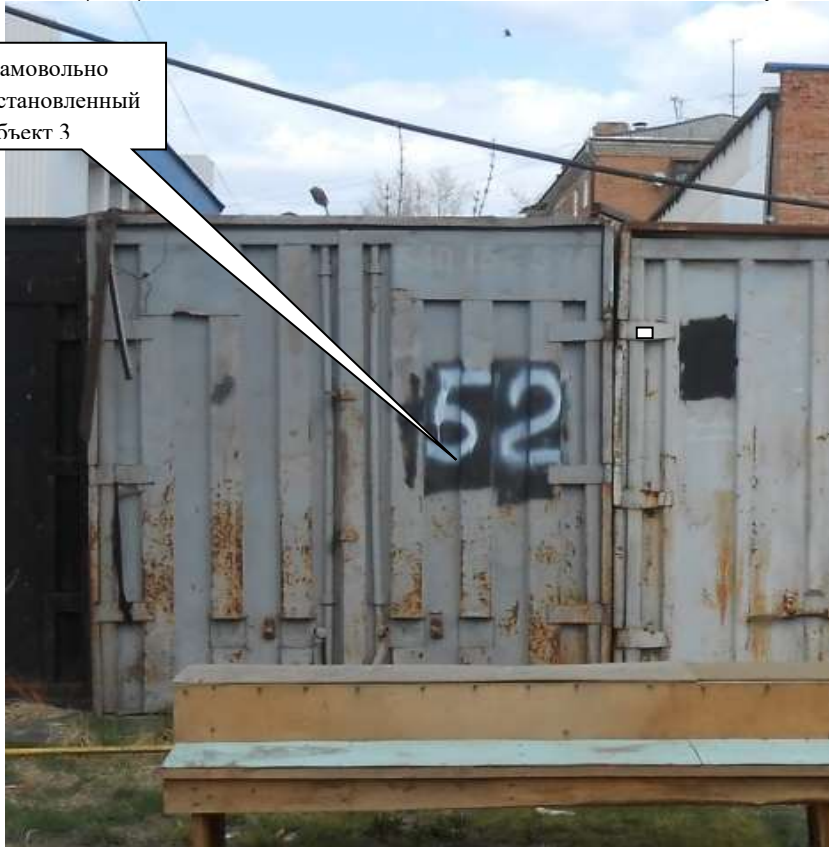
Информация о факте выявления самовольно установленного некапитального временного объекта по адресу ориентир: г. Канск, ул. Московская, 84 (объект 4)