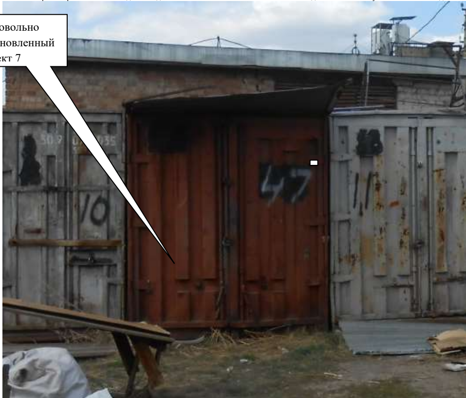
Информация о факте выявления самовольно установленного некапитального временного объекта по адресу ориентир: г. Канск, ул. Московская, 84 (объект 8)