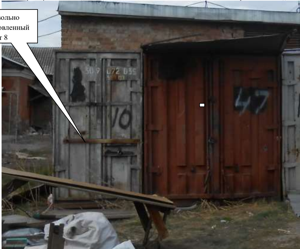
Информация о факте выявления самовольно установленного некапитального временного объекта по адресу ориентир: г. Канск, ул. Московская, 84 (объект 9)