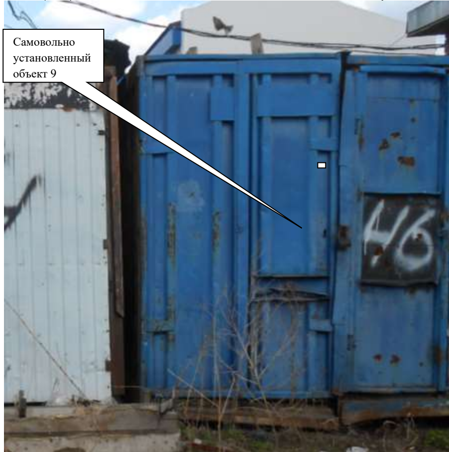
Информация о факте выявления самовольно установленного некапитального временного объекта по адресному ориентиру: г. Канск, ул. Московская, 84 (объект 10)

Комиссия приняла решение о необходимости демонтажа некапитального объекта и освобождении земельного участка в течение 7 дней со дня опубликования.