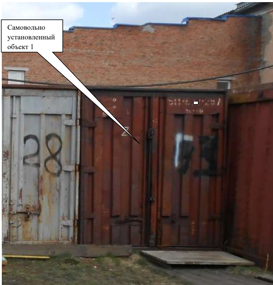
Самовольно установленный объект 1

Информация о факте выявления самовольно установленного некапитального временного объекта по адресу ориентир: г. Канск, ул. Московская, 84 (объект 2)