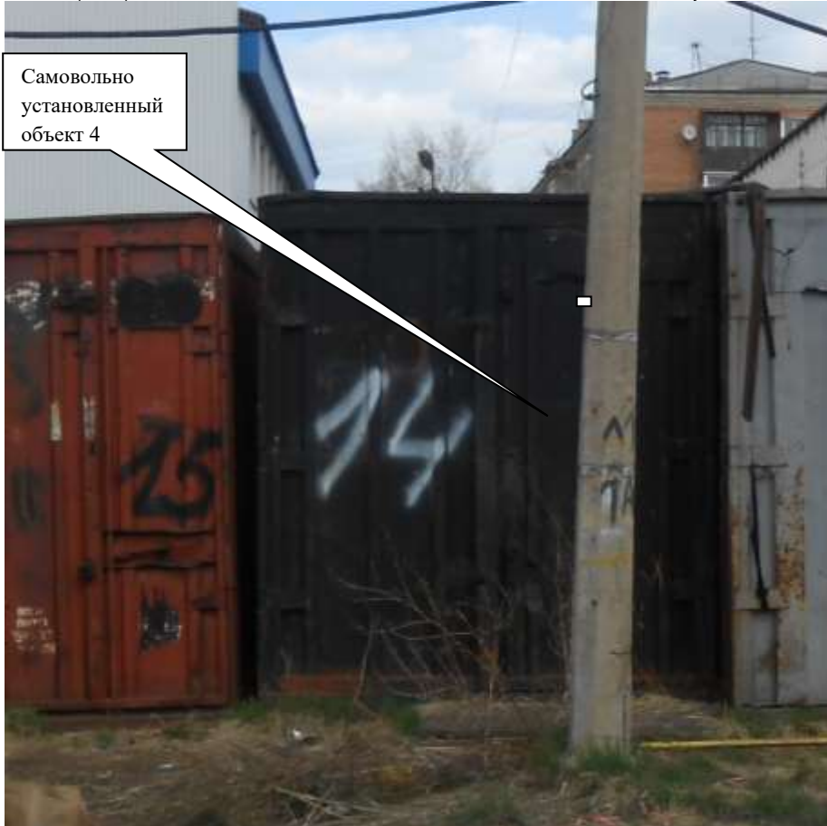
Информация о факте выявления самовольно установленного некапитального временного объекта по адресу ориентир: г. Канск, ул. Московская, 84