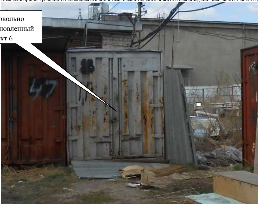
Информация о факте выявления самовольно установленного некапитального временного объекта по адресу: ориентир: г. Канск, ул. Московская, 84