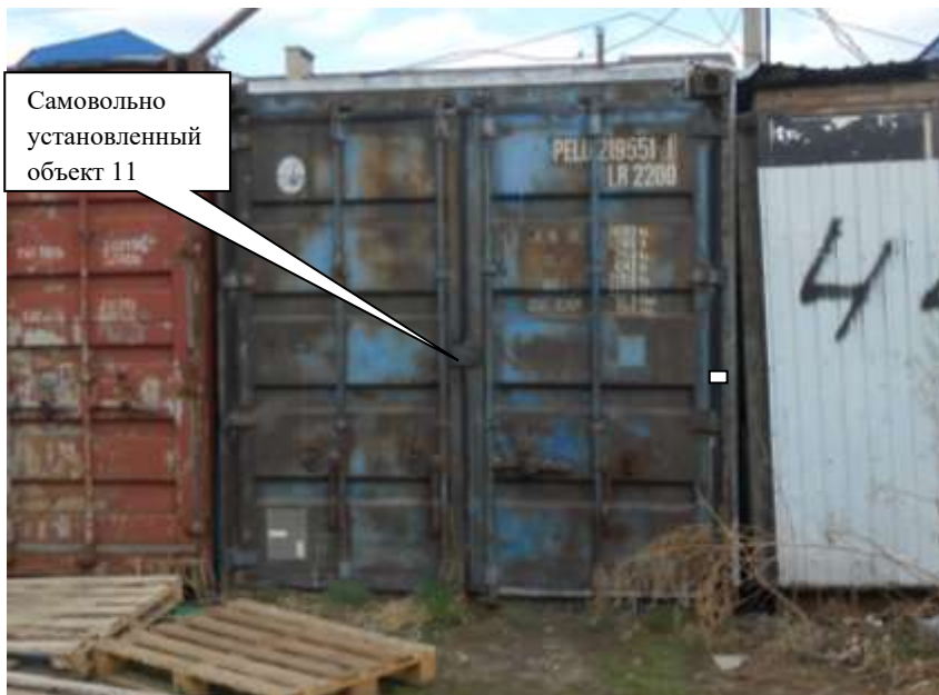
Информация о факте выявления самовольно установленного некапитального временного объекта по адресу ориентуру: г. Канск, ул. Московская, 84 (объект 12)