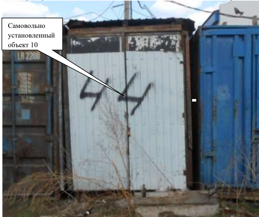
Информация о факте выявления самовольно установленного некапитального временного объекта по адресному ориентиру: г. Канск, ул. Московская, 84 (объект 11)

Комиссия приняла решение о необходимости демонтажа некапитального объекта и освобождении земельного участка в течение 7 дней со дня опубликования.