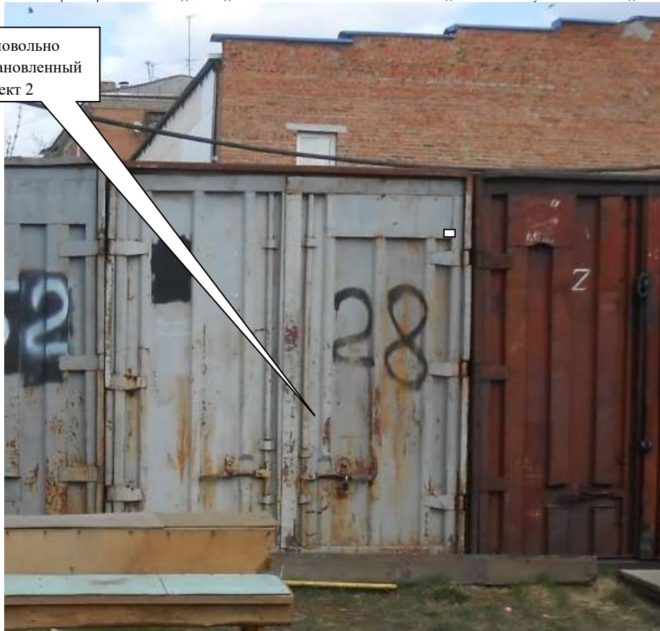
Самовольно установленный объект 2

Комиссия приняла решение о необходимости демонтажа некапитального объекта и освобождении земельного участка в течение 7 дней со дня опубликования.