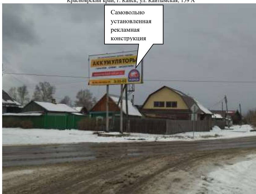
Приложение 4 к постановлению № 1026 от 09.12.2021

Красноярский край, г. Канск, ул. Кайтымская, 159 А