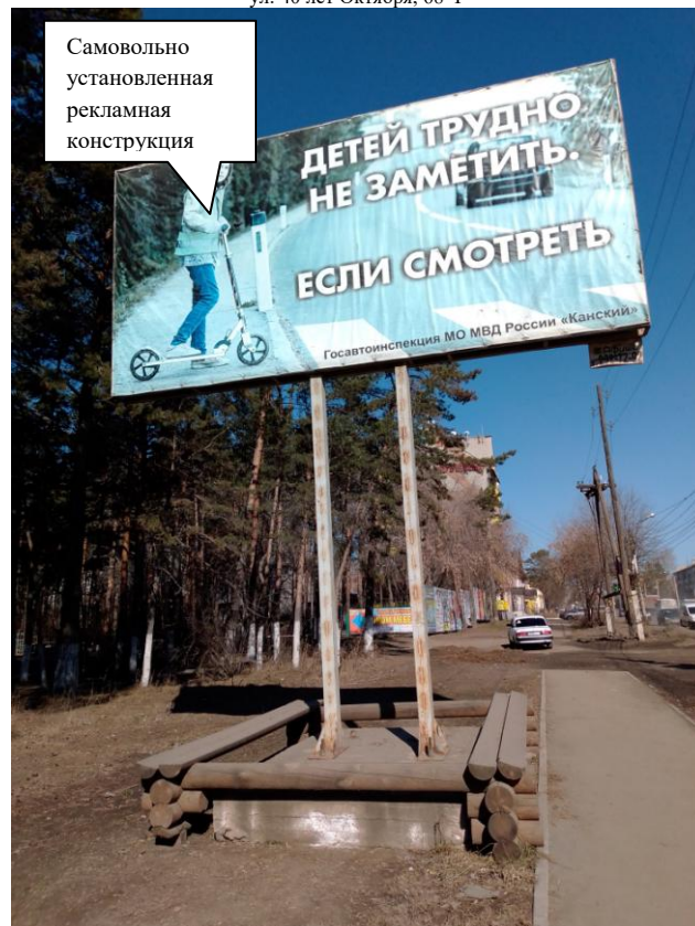
ул. Магистральная, напротив дома № 109