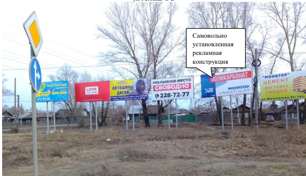
ул. 40 лет Октября, 68 Г