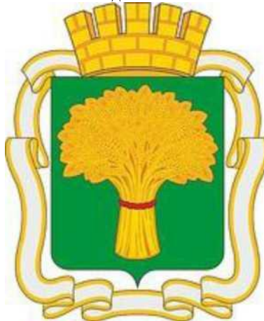
СХЕМА ТЕПЛОСНАБЖЕНИЯ ГОРОДА КАНСКА НА ПЕРИОД С 2013 ГОДА ДО 2028 ГОДА. АКТУАЛИЗАЦИЯ НА 2022 ГОД УТВЕРЖДАЕМАЯ ЧАСТЬ

Разработчик: ООО «Ивтеплонадка» г. Иваново Директор А.А. Зубанов